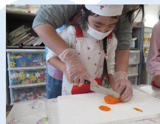
薄くスライスします。