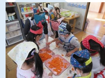
形は星とハートえらべるよ！