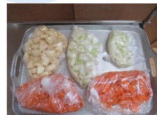
こんなに沢山調理してくれました！

今回の食育活動は、らいおん組がカレーライス作りをしました。作ったカレーライスは園のみんなにもふるまいました。らいおん組はいろいろな食材を使ってらいおんの顔にデコレーションしました。