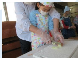
じゃがいも、玉ねぎ、にんじんを包丁で切りました。集中していました。