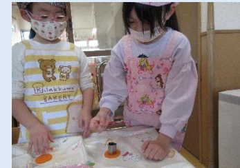
形はハートにしようかな～！