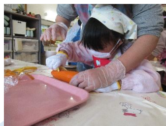
ピーラーで皮をむきました。